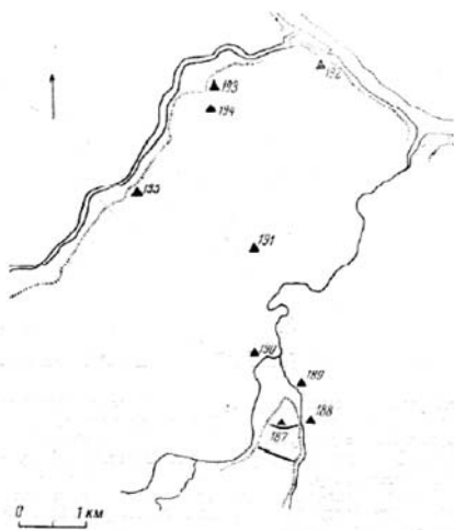
Рис. 29. Галич.

Бокові стіни старовинної церкви та її бокові апсиди збереглися на висоту близько 7 м, а середня частина західного фасаду — майже до 14 м. Тут над західним порталом уціліла декоративна квадратна рамка з вікном. Центральна апсида збереглася на висоту 9,4 м; у ній є