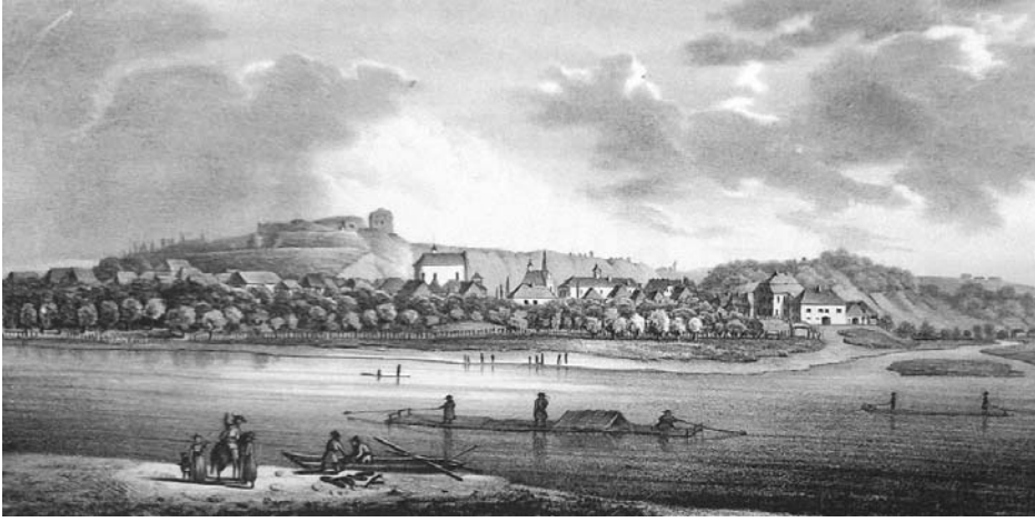
Іл. 3. Загальний вигляд Галича з північної сторони. Мацей-Богуш Стенчинський, 1847 р.