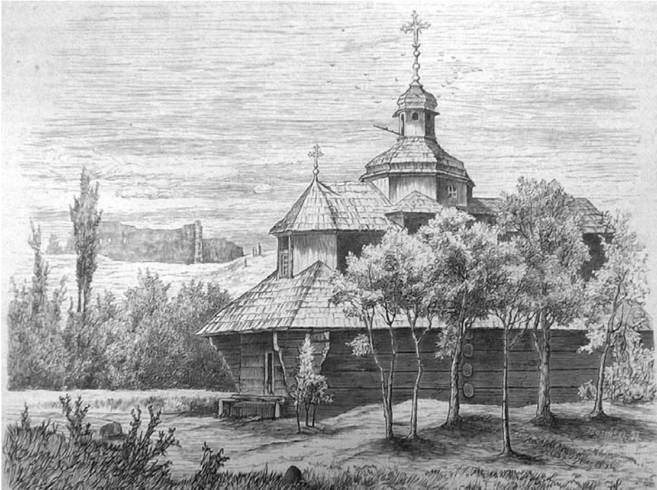
Іл. 4. Церква Святого Миколая в Галичі. Генрих Грабінський, друга половина XIX ст.