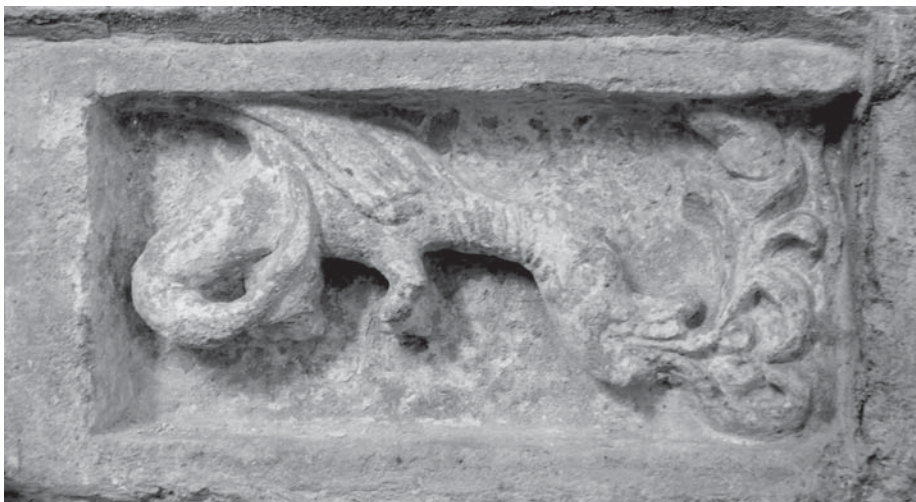
Рис 1. Галицький рельєф з драконом, XII ст.

Зверху вона має ширину 4 см, лівий бік рами дорівнює 7–8 см, нижня частина – 4–5 см. Права частина блока обламана. Ритуальність композиції і характер зламу дають підстави припускати наявність ще одного, парного зображення. Відсутність слідів різьблення на зламі виключає можливість кутового зображення. Малюнок обрамлення – широкий, ліва частина, що завершує сюжет, вужча нижня і найтонша верхня, а також розміри блока дозволяють вважати, що спочатку це був архітравний камінь з типовим бінарним зображенням подібного ж фантастичного звіра. Наявність пальмети, що має закінчену форму, а також численних аналогій з подібними «догматичними» сюжетами робить досить імовірним припущення про те, що по осі симетрії зазвичай містилося зображення у вигляді хреста, хризми, солярного знака або іншого символу, який відігравав роль ідейного і композиційного центру. Схожі сюжети із зображеннями парних фігур трапляються в порталах Угорщини, Польщі, Німеччини, Італії та інших країн 4 (рис. 2).