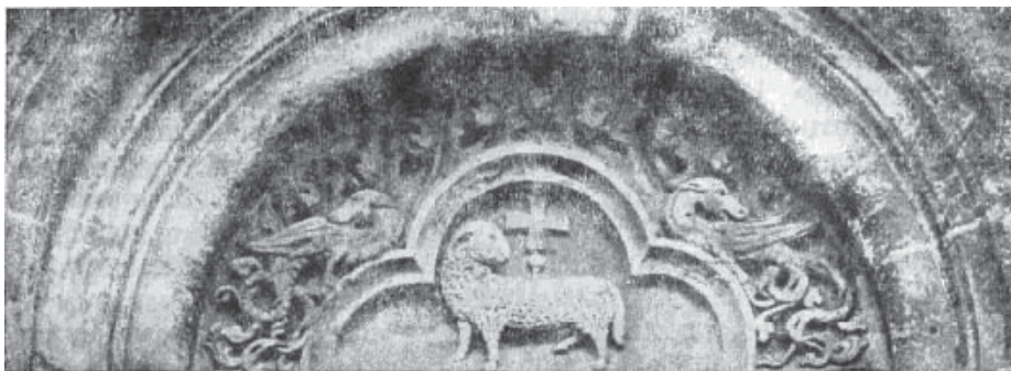
Рис. 2. Тимпан церкви в Яці Угорщина, XIII ст.

Отже, рельєф радше є поєднанням двох драконів, які фланкують центральне космогонічне зображення. Тут загальна довжина блока дорівнювала приблизно 160–180 см. Якщо врахувати, що опора блока становила з кожного його боку по 15–20 см, то портал, перекритий кам'яною плитою, дорівнював 130–140 см. Кам'яні блокові перемички часто трапляються в романських храмах XI–XII ст. Їхня висота зазвичай становить 1/5 загальної довжини, що відповідає передбачуваним розмірам блока з драконом ( 33 \times 5 = 165 см). Ця величина відповідала прийнятій ширині порталів у давньоруських будівлях XII ст.: портал Борисоглібського собору в Чернігові мав ширину 125 см, церкви Пантелеймона в Галичі – 135 см, бокові портали храму Софії в Києві – 140 см, церкви Василя в Овручі – 140 см, Успенського собору у Володимирі – 150 см. Слід відзначити, що портал храму Георгія (1157) у Володимирі, який побудували галицькі майстри 5 , мав ширину 125–130 см.