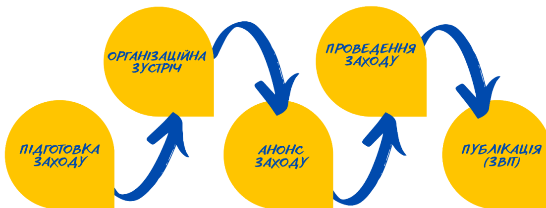
Рис. 1. Технологія проведення заходів для дітей-переселенців

Під час реалізації та організації заходів для дітей ВПО ми керувались певною технологією, яку ми розробили та адаптували у ході проведення цих заходів (Рис. 1). Першим етапом до реалізації заходу є його підготовка, яка здійснюється усіма залученими учасниками. Сюди належить визначення мети заходу, його складників, виділення ролей учасників, цільової аудиторії, напрям заходу, на якому базуватимуть наступні етапи. Другий етап – організаційна зустріч, під час якої усі залучені особи обговорюють реалізацію заходу, організаційні питання; відбувається розподіл ролей, за які відповідальні учасники. Під час цього етапу створюється макет (сценарій) майбутнього заходу. Третій етап – анонс заходу: створюється прес-реліз, який розміщується на сайті громадської організації, соціальних мережах організації та зацікавлених сторін, долучених до проведення заходу. Четвертий етап – проведення заходу. П’ятий етап – публікація результатів заходу (звіт), де розміщуються фото і відеоматеріали підкріплені текстовим описом проведення заходу, зазначаються учасники, присутні гості, коротко описується весь захід.