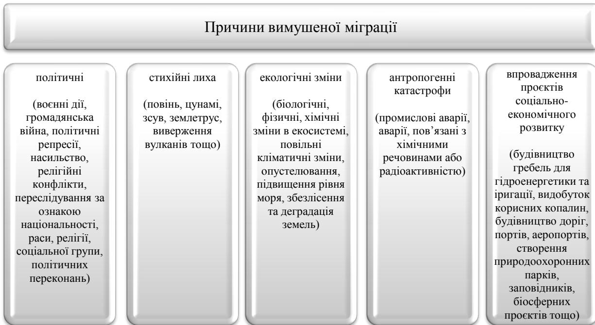
Рис. 1. Причини вимушеної міграції *