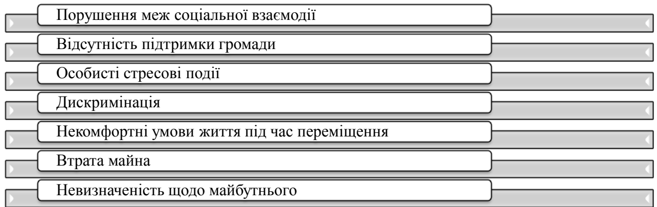
Рис. 3. Найпоширеніші стресові фактори, що негативно впливають на осіб, які постраждали від війни

Для людей, які потрапили в складні життєві обставини, пережили кризову ситуацію, важливе значення має не лише входження в нове соціальне середовище, а й відновлення психологічного стану, зумовленого стресовими факторами (рис. 3).