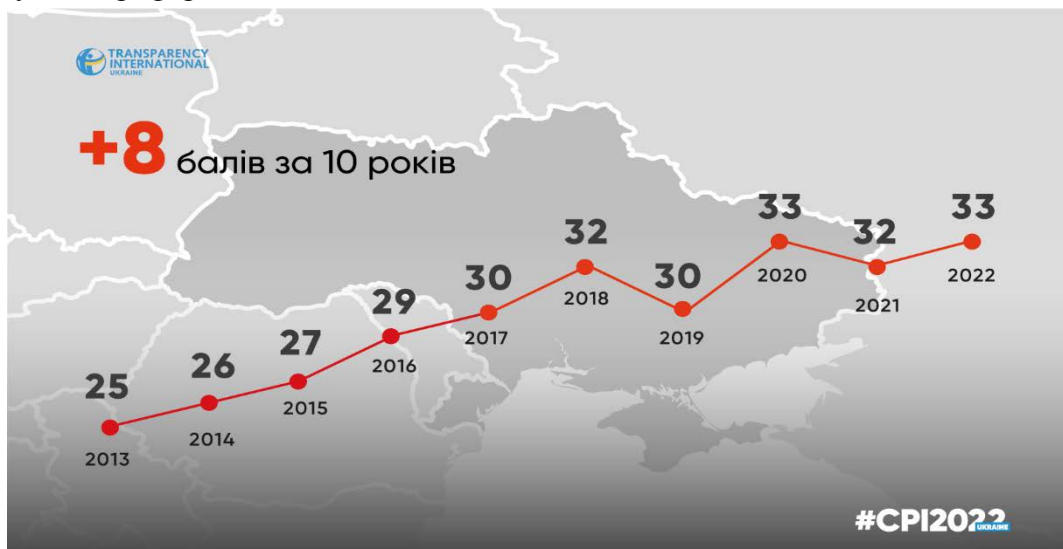
Рис. 2. Динаміка України в рейтингу сприйняття корупції 2013-2022 роки Fig.2. Dynamics of Ukraine in the ranking of corruption promotion 2013-2022 Джерело: [3]

Наприклад, перед тим, як Росія вторглася в Україну в лютому цього року, громадянське суспільство було дуже активним у тисненні на уряд з метою призначення головного антикорупційного прокурора. Зараз громадські групи зосереджені на війні, але після перемоги України (і особливо якщо вона матиме дорожню карту вступу до ЄС), внутрішні проблеми знову будуть на порядку денному. Ми віримо, що багато людей в Україні розуміють, що Україна не може (знову) втратити історичний шанс. Ми також віримо, що вихід України на шлях вступу до ЄС стане потужним стимулом для просування реформ [8].