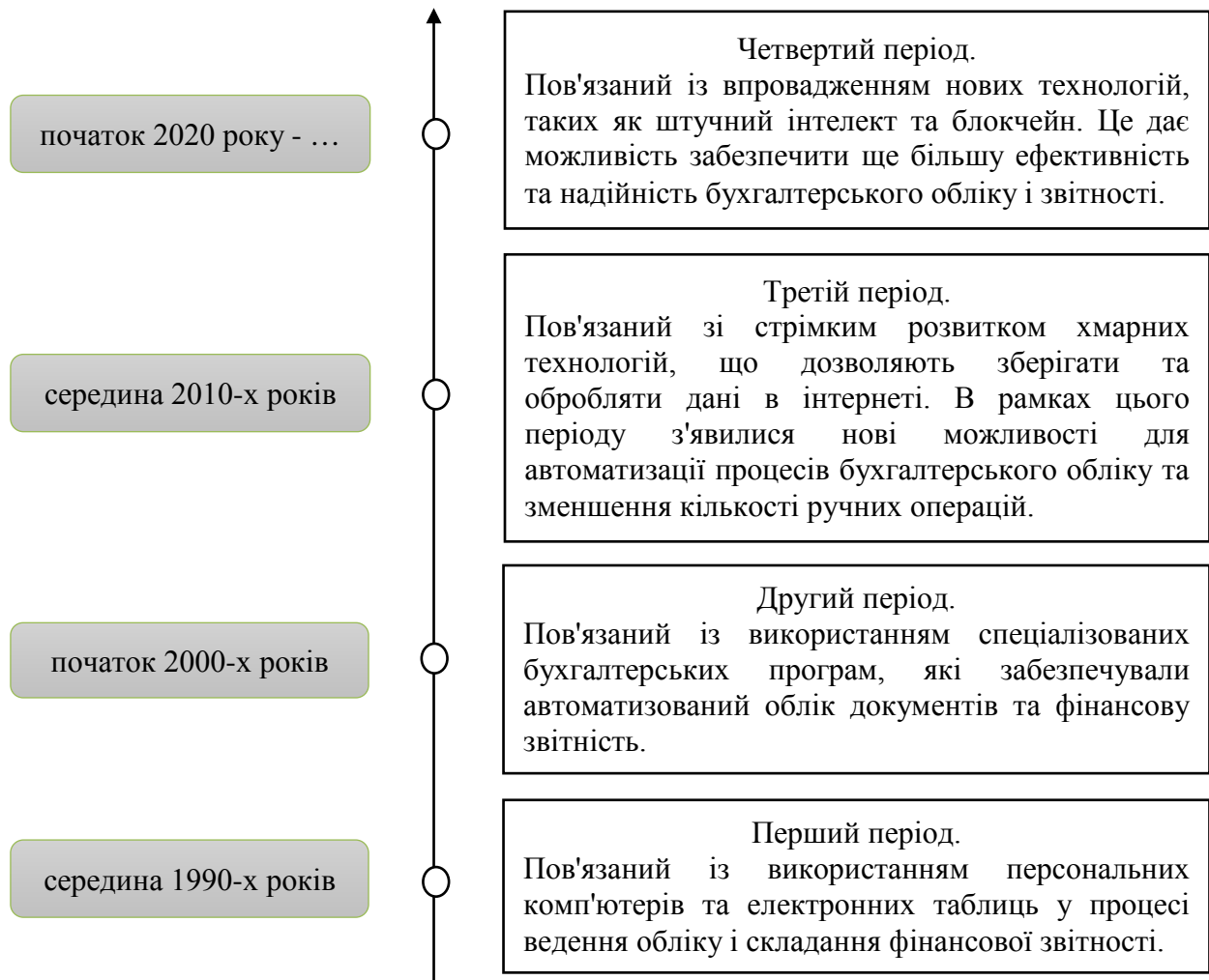
Рис. 2. Періоди цифровізації бухгалтерського обліку в Україні