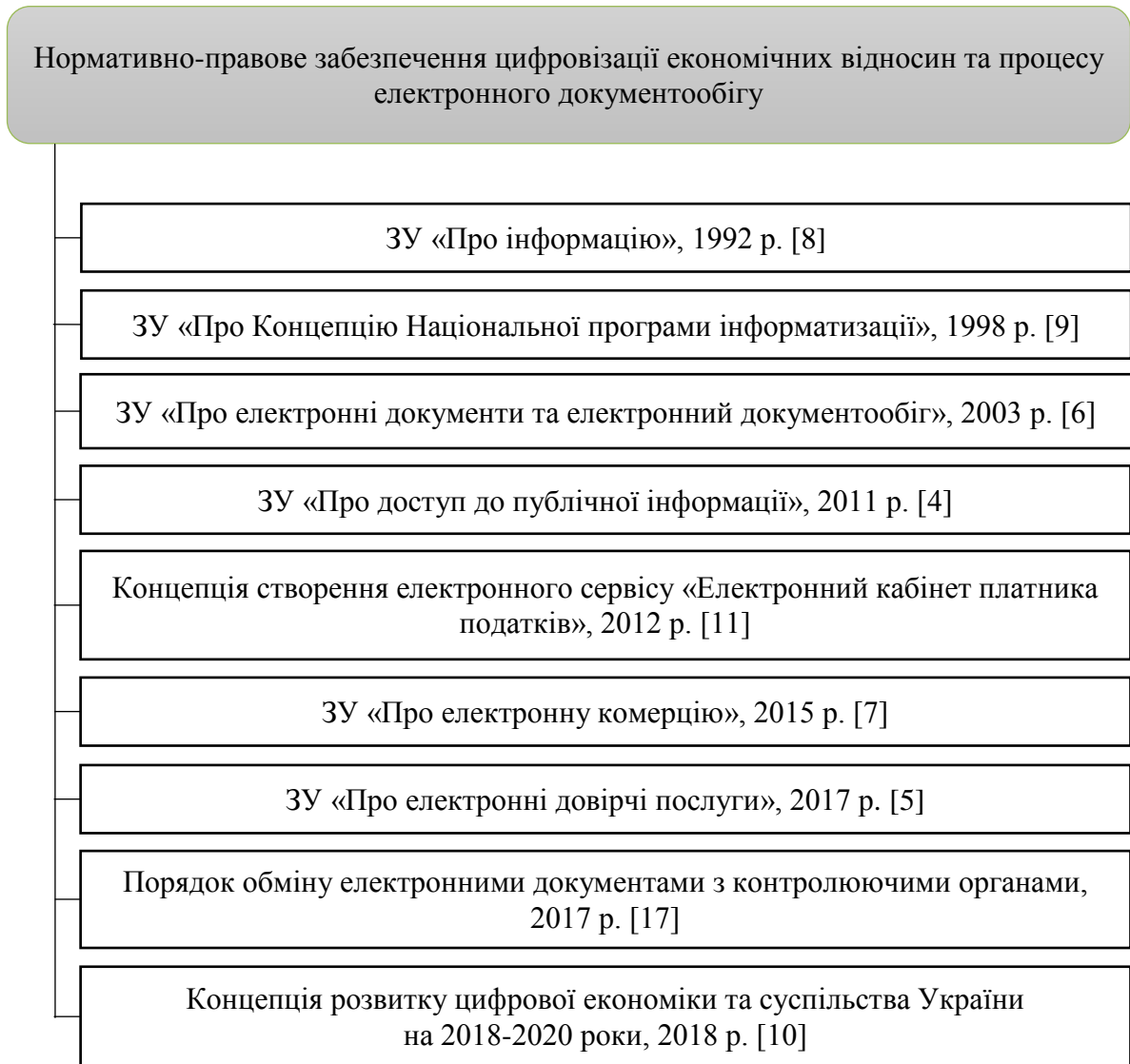
Рис. 1. Нормативно-правове забезпечення цифровізації економічних відносин та процесу електронного документообігу