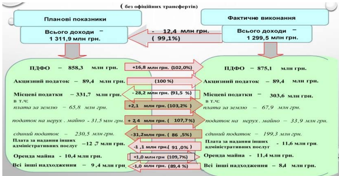
Рис. 2. Аналіз доходів загального фонду м. Івано-Франківська за 9 місяців 2020 р. [9].