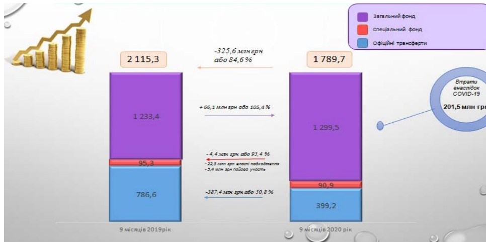
Рис. 1. Динаміка надходжень доходів Івано-Франківської ОТГ за 9 місяців 2019-2020 рр. [9].

Зменшення надходжень до місцевих бюджетів призведе до необхідності перегляду видаткової частини місцевих бюджетів. Крім того, додаткового фінансування потребує сфера охорони здоров'я, оскільки видатки, передбачені рішеннями про місцеві бюджети, недостатні для ефективної боротьби з пандемією, забезпечення медичних закладів та закладів освіти всім необхідним.