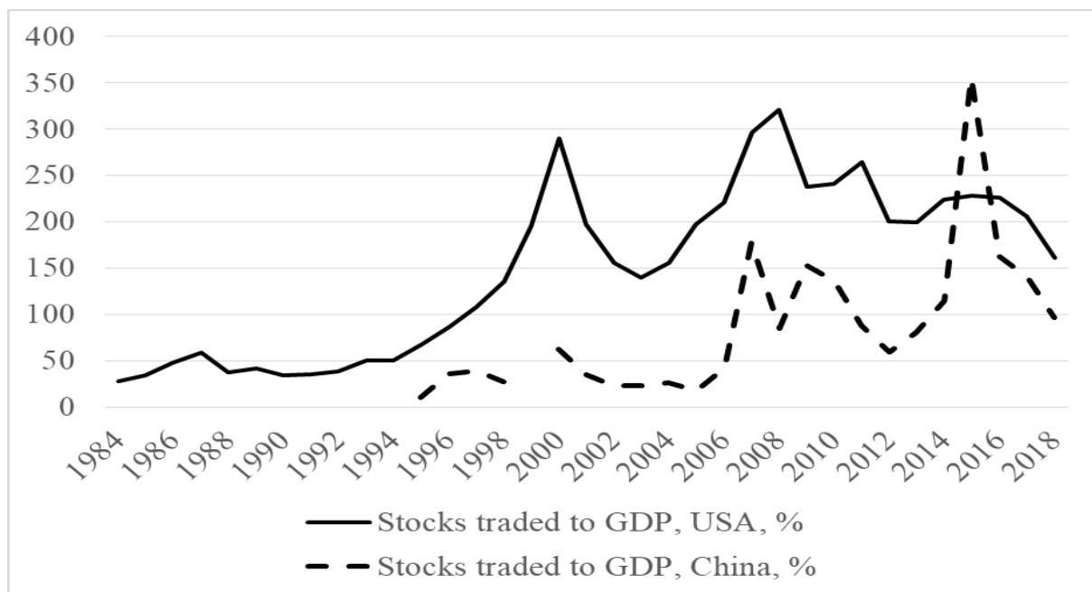
Рис. 3. Співвідношення обсягу торгівлі цінними паперами до ВВП у США та Китаї за 1984 – 2018 pp., %