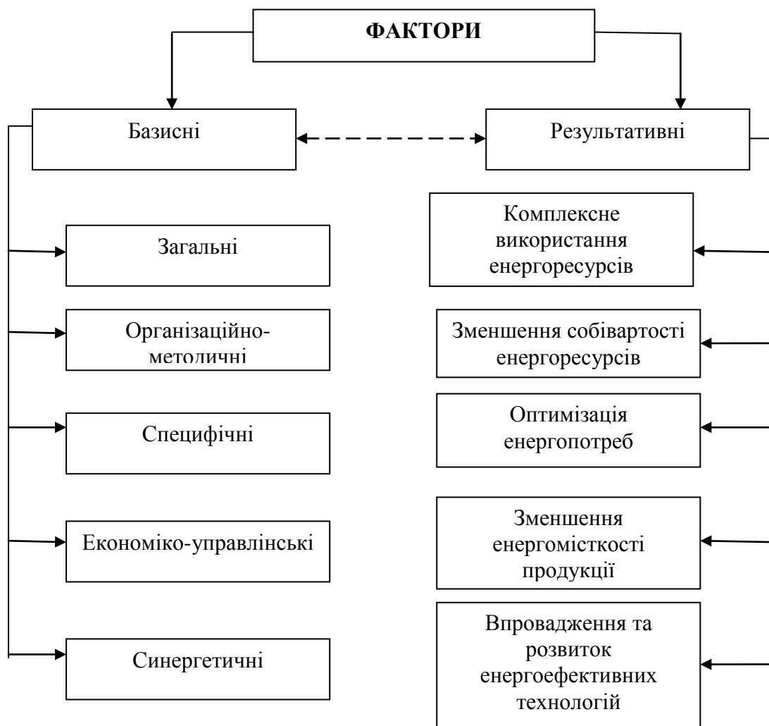
Рис. 3. Комплекс факторів стратегії розвитку енергокластеру*